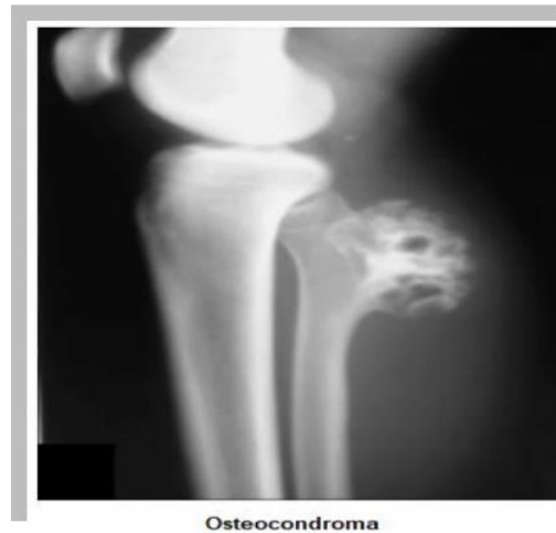
Figura 6. Se muestra la imagen radiológica del tumor con pie de grabado en la foto, así con cada una de las lesiones tumorales 6 .

lesiones múltiples (ostecondromatosis). El dolor y el rápido crecimiento después de la madurez esquelética son signos de alerta de transformación maligna.